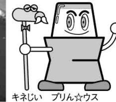
キネじい プリン☆ウス